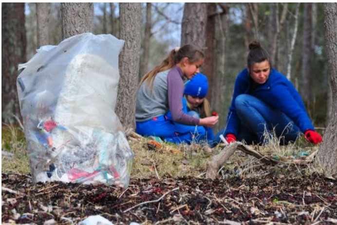
Friluftsrådet Nordmøre og Romsdal organiserer rydding av strender både med frivillige og profesjonelle ryddere.

FNR er en sentral aktør i arbeidet mot marin forsøpling i regionen. FNR organiserer og samordner profesjonelle og frivillige strandryddeaktører og er bindeledd til kommuner og nasjonale myndigheter og organisasjoner.