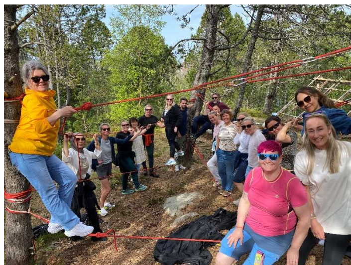
Lærerne på Allaneneng skole i Kristiansund deltok på kurs og lærte seg å henge opp taubruer. Totalt deltar 13 skoler fra 7 kommuner i nettverket for Læring i friluft for alle.

Pilotprosjektet Læring i friluft for alle (Lifa) går inn i sitt siste år, men vi søker om midler til å fortsette samarbeidet med de 13 skolene hos oss som er med. Samtidig ønsker vi å utvide skolesatsinga ved å starte opp med Lifa på flere skoler høsten 2025. Kursing av hele personalet i praktiske aktiviteter og undervisningsopplegg, deling av kunnskap og nettverksbygging er sentrale tema. Vi vil også jobbe for at skolene skal markere Friluftslivets år og håper å få med mange skoler på hele Norge båler og Friluftsknappen . I tillegg planlegger vi friluftslivdager i de videregående skolene, dette vil skje i samarbeid med FNF-organisasjonene og Møre og Romsdal fylkeskommune. I 2025 vil vi blant annet ha fokus på marin forsøpling og kartbruk/opplæring i skolen.