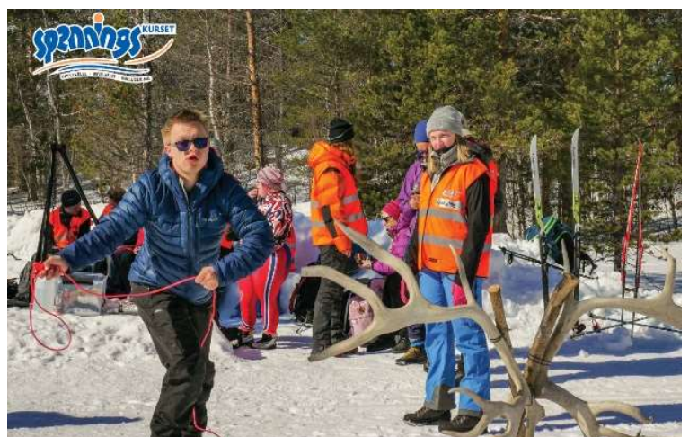
Spenningskurset på Bjorli er vinterens høydepunkt for mange, både instruktører og deltakere.

Tilrettelegging er viktig for at alle kan komme seg ut i naturen. FNR kartlegger tilgjengelighet for bl.a. rullestolbrukere, på oppdrag fra Kartverket. Kunnskap om dette er viktig for kommuner og frivillige som tilrettelegger for at folk skal komme seg ut.