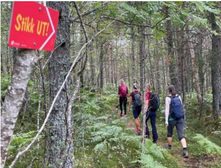
Stikk UT! har svært bred oppslutning og tilbyr turer som passer for alle. I brukerundersøkelser sier mange at Stikk UT! er motiverende og hjelper mange over dørstokken til aktivitet og turglede.

Stikk UT! er vår største aktivitet med deltakere tilsvarende 20% av innbyggerne i regionen. Stikk UT! gjør det enkelt å delta i alle kommunene og er Friluftsrådets viktigste verktøy for å nå ut til våre målgrupper. Stikk UT! gjennomføres i samarbeid med kommunens Stikk UT!-kontakter, frivillige, grunneiere, fylkeskommunene, skikretsen med flere. Også gjennom Stikk UT! jobber vi kontinuerlig med bærekraftig friluftsliv, blant annet med sporløs ferdsel og Stikk UT!-vettregler og Stikk UT!-stifond.