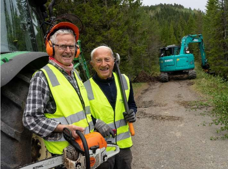
Godt samarbeid mellom myndigheter og frivillige er avgjørende for god tilrettelegging. Her er Freimarkas Venner på jobb for friluftslivet.

FNR jobber for at arealer for friluftsliv kartlegges og ivaretas, og at sikring og utvikling gjøres planmessig og bærekraftig til beste for mennesker og natur. Vi bistår kommunen som arealmyndighet og jobber for et best mulig samarbeid mellom kommune, regionale myndigheter og frivilligheten som står for mye av tilretteleggingsarbeidet.