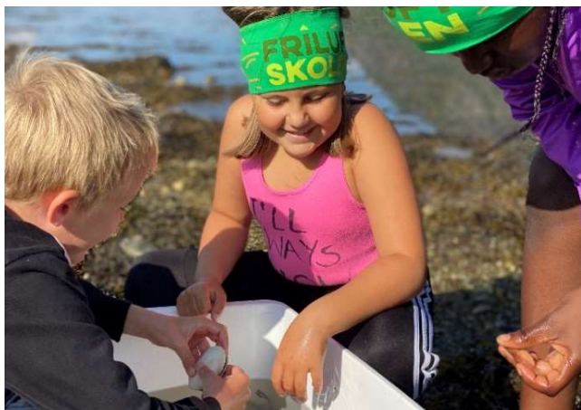
Glede ved å være i aktivitet ute samt kunnskap om og respekt for natur er tema på Friluftsskolen.

Friluftsskolen er et ferietilbud for barn i nærmiljøet for å gi en lystbetont introduksjon til friluftsliv. Skolene skal være åpen for alle og ha lav deltakeravgift/gratisplasser. Gjennomføringen er avhengig av godt samarbeid med kommune, frivilligsentraler, kulturinstitusjoner, lag, foreninger og ildsjeler. Ledere og ungdomsledere rekrutteres fra organisasjonene og ellers lokalt. Lederne er svært viktige for gjennomføring og FNR bruker mye ressurser på å rekruttere og utvikle disse dyktige ungdommene.