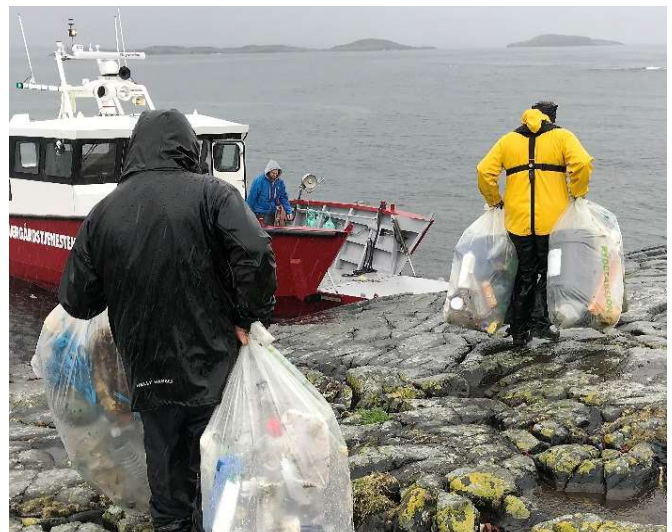
Skjærgårdstjenesten jobber for det sjøbaserte friluftslivet og er et viktig verktøy i arbeidet mot marin forsøpling.

Båten «Rigmor» benyttes til oppdrag knyttet til tilrettelegging i friluftsområder og arbeid mot marin forsøpling. «Rigmor» er stasjonert hos Sunnmøre friluftsråd og i 2025 vil det bli jobbet videre med å finne den beste løsningen for Skjærgårdstjenesten også i Nordmøre og Romsdal. Det må blant annet avklares om det skal stasjoneres en egen båt i vår region, samt evt. finne finansiering for denne, i tett samarbeid med Miljødirektoratet, fylkeskommune og Sunnmøre friluftsråd.